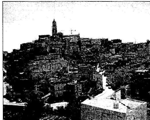
Una veduta dei Sassi e la diga di San Giuliano

L'originalità della proposta, infatti, non sta solo nell'aver messo insieme un così grande numero di soggetti, ma anche e soprattutto nel ruolo